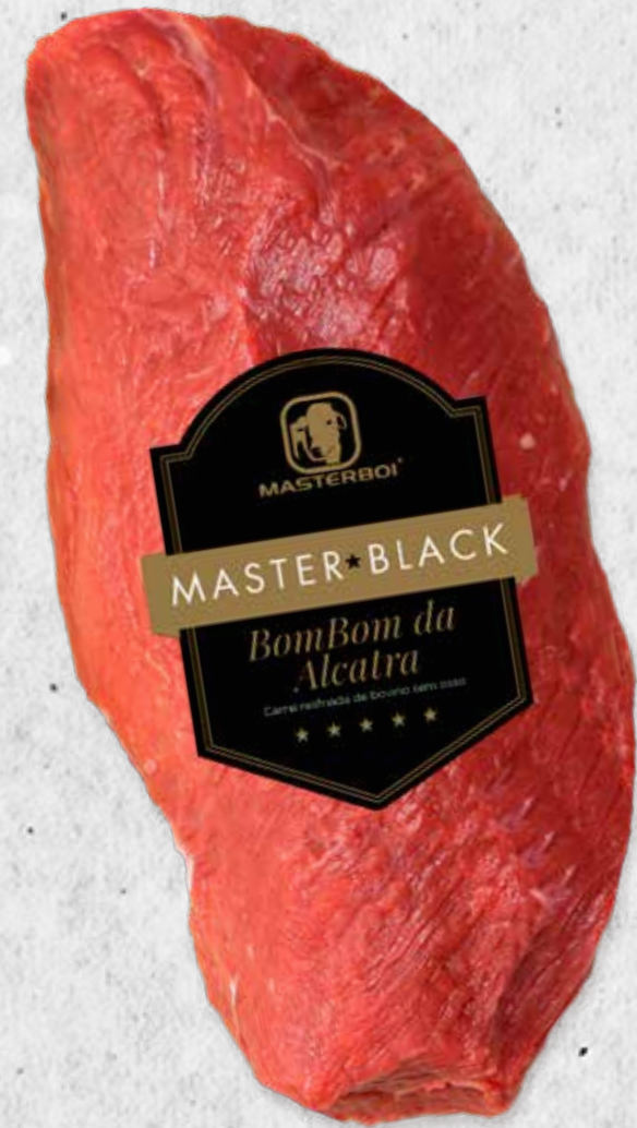
BOMBOM DA ALCATRA