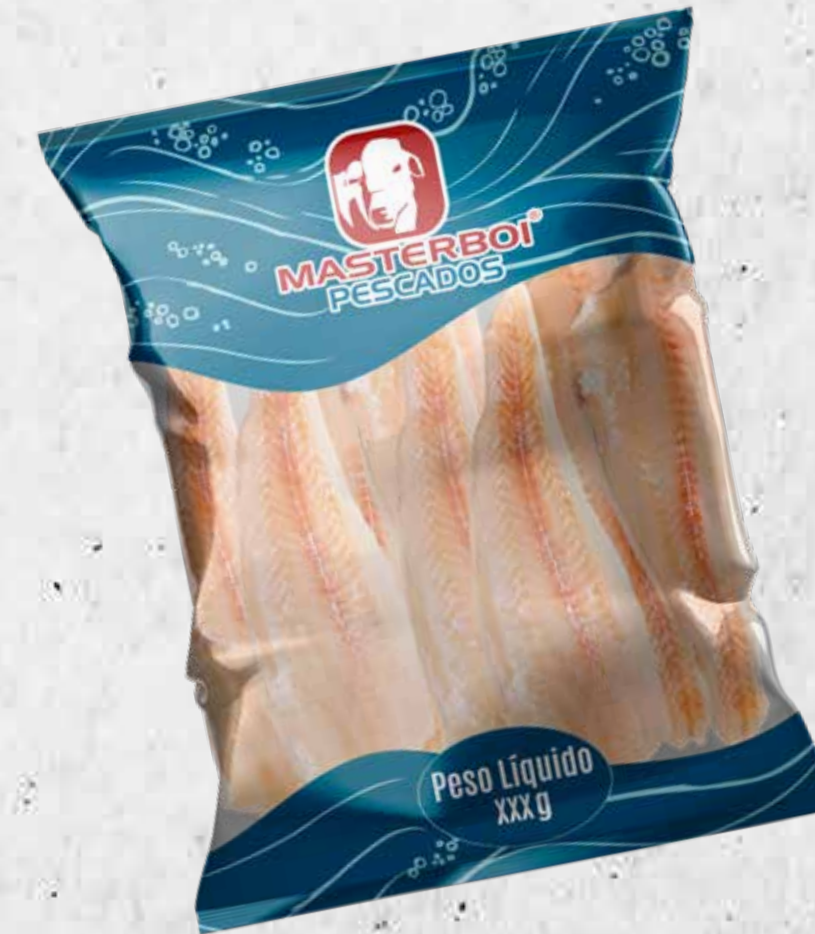
FILÉ DE TILÁPIA