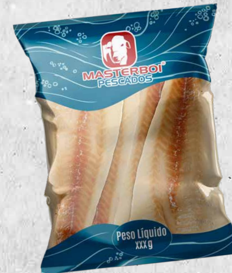
FILÉ DE POLACA DO ALASCA