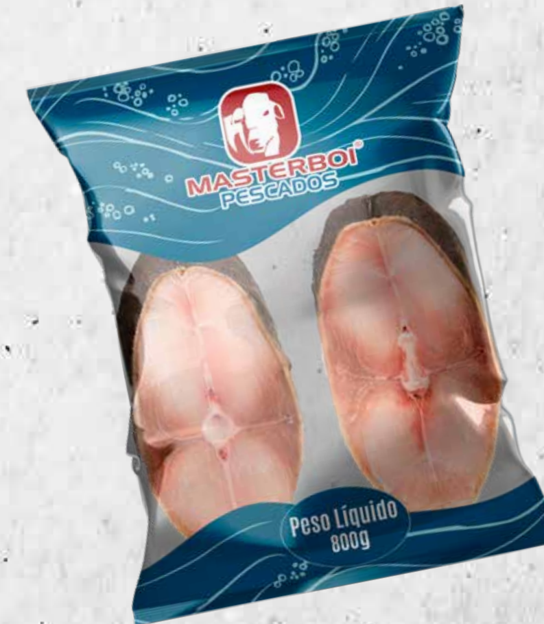
POSTA DE AGULHÃO