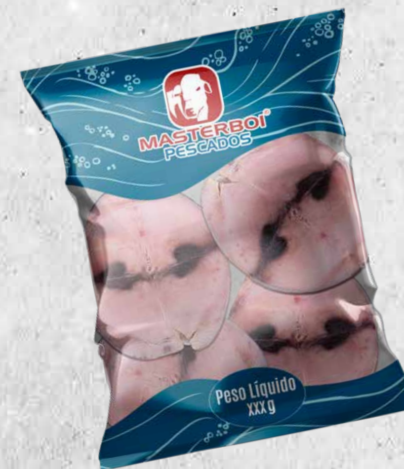
POSTA DE ATUM