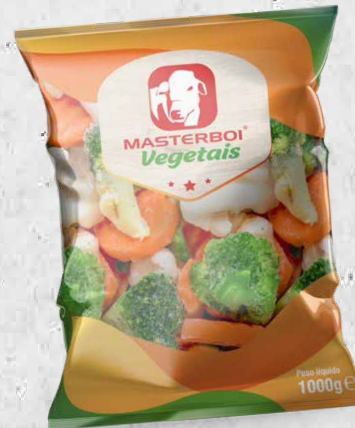
MIX DE VEGETAIS