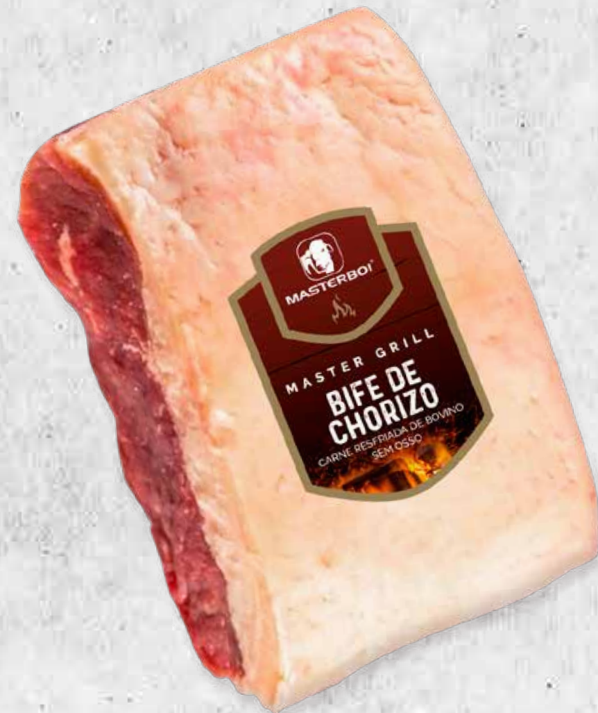
BIFE DE CHORIZO