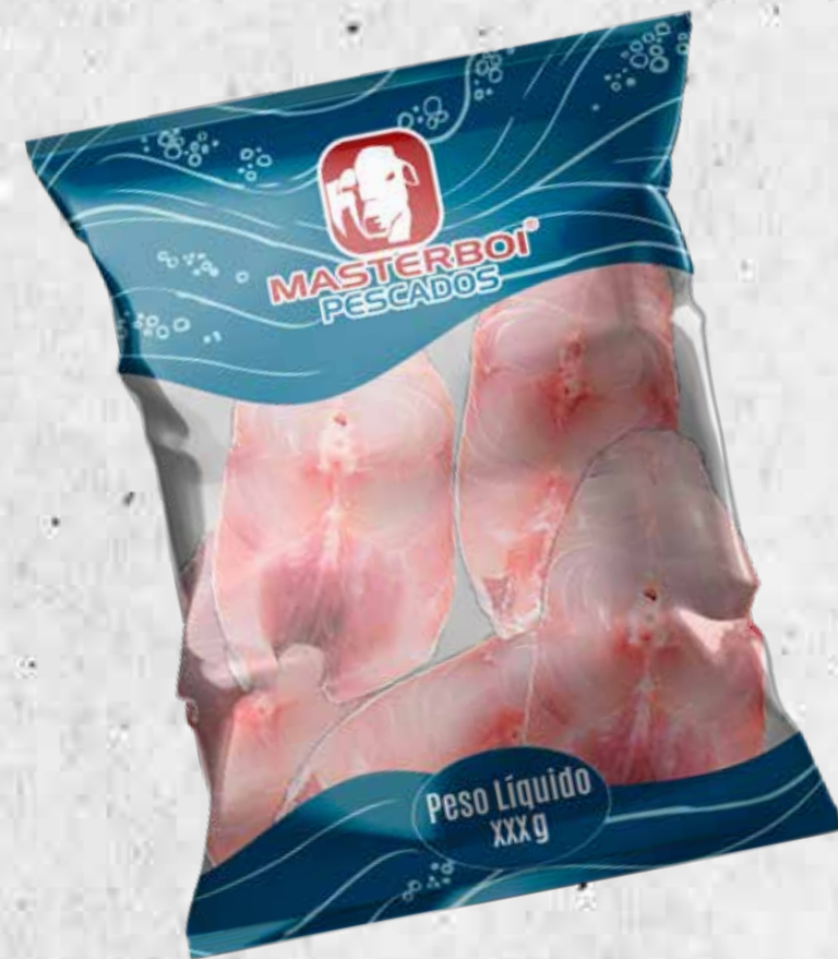
POSTA DE CORVINA