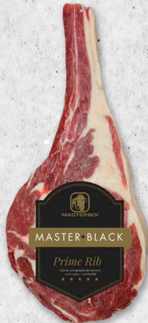
PRIME RIB FATIADO