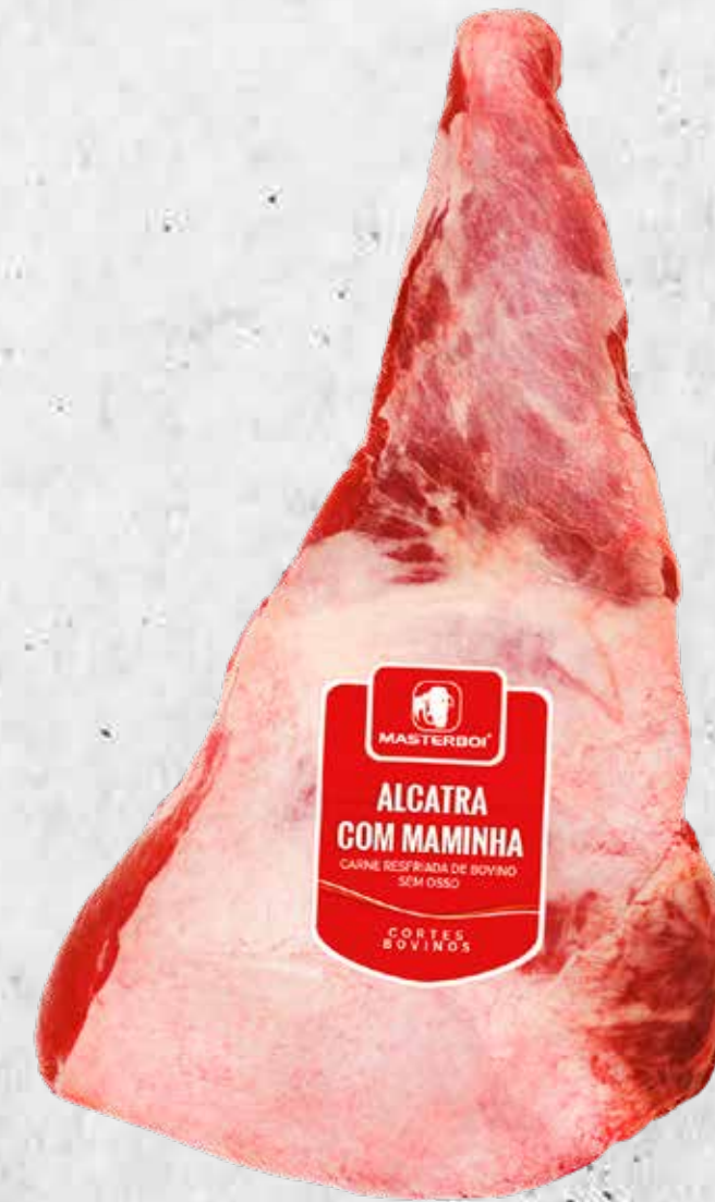
ALCATRA COM MAMINHA