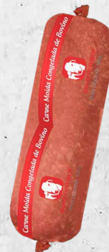
CARNE MOÍDA TUBETE