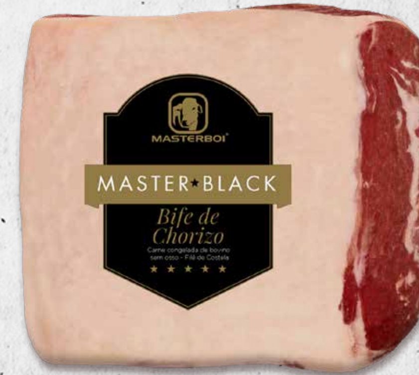
BIFE DE CHORIZO