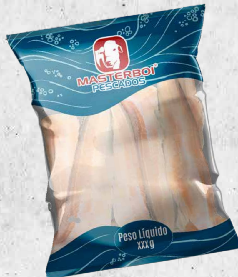
FILÉ DE MERLUZA