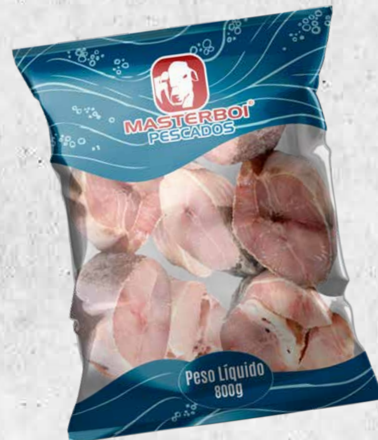
POSTA DE PIRAMUTABA